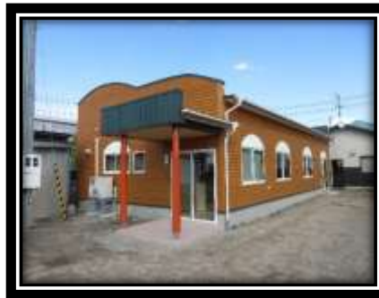
＜子育て支援センター＞